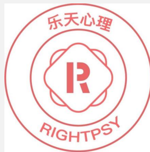
微信公众号“乐天心理咨询”

◆ 24小时电话咨询热线 ：021-52951186（由国家二级心理咨询师接听电话）